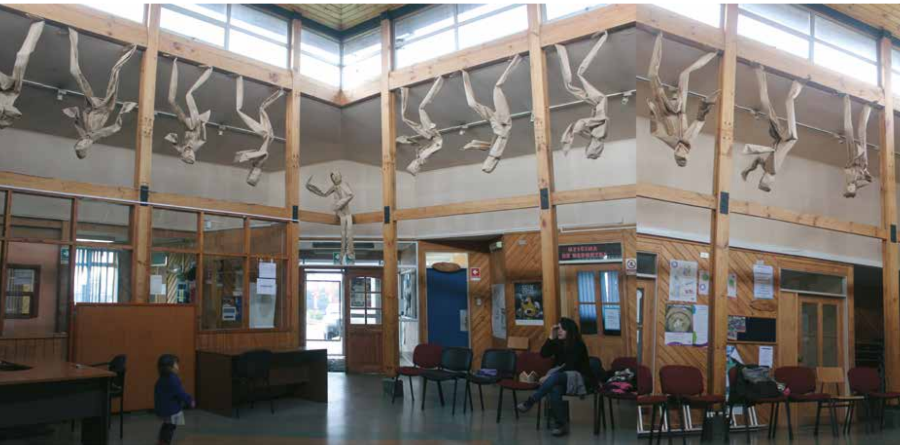
Delegación Municipal Alerce