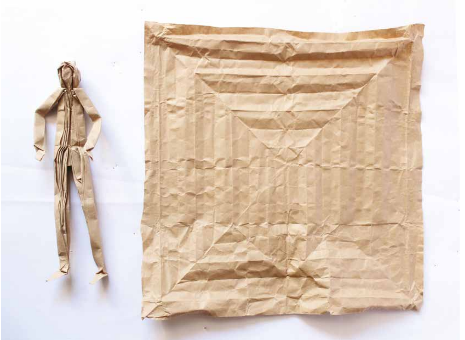
Un cuadrado y 76 pliegues