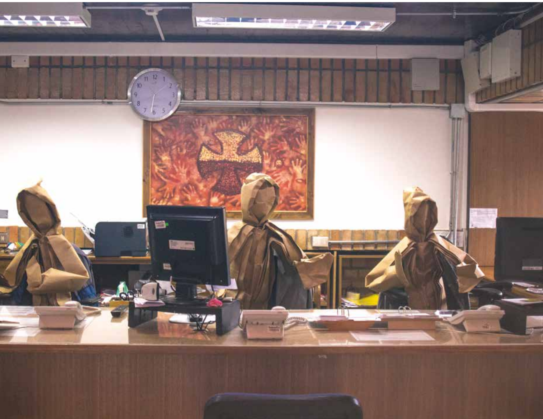
Instituto Teletón Sede Puerto Montt