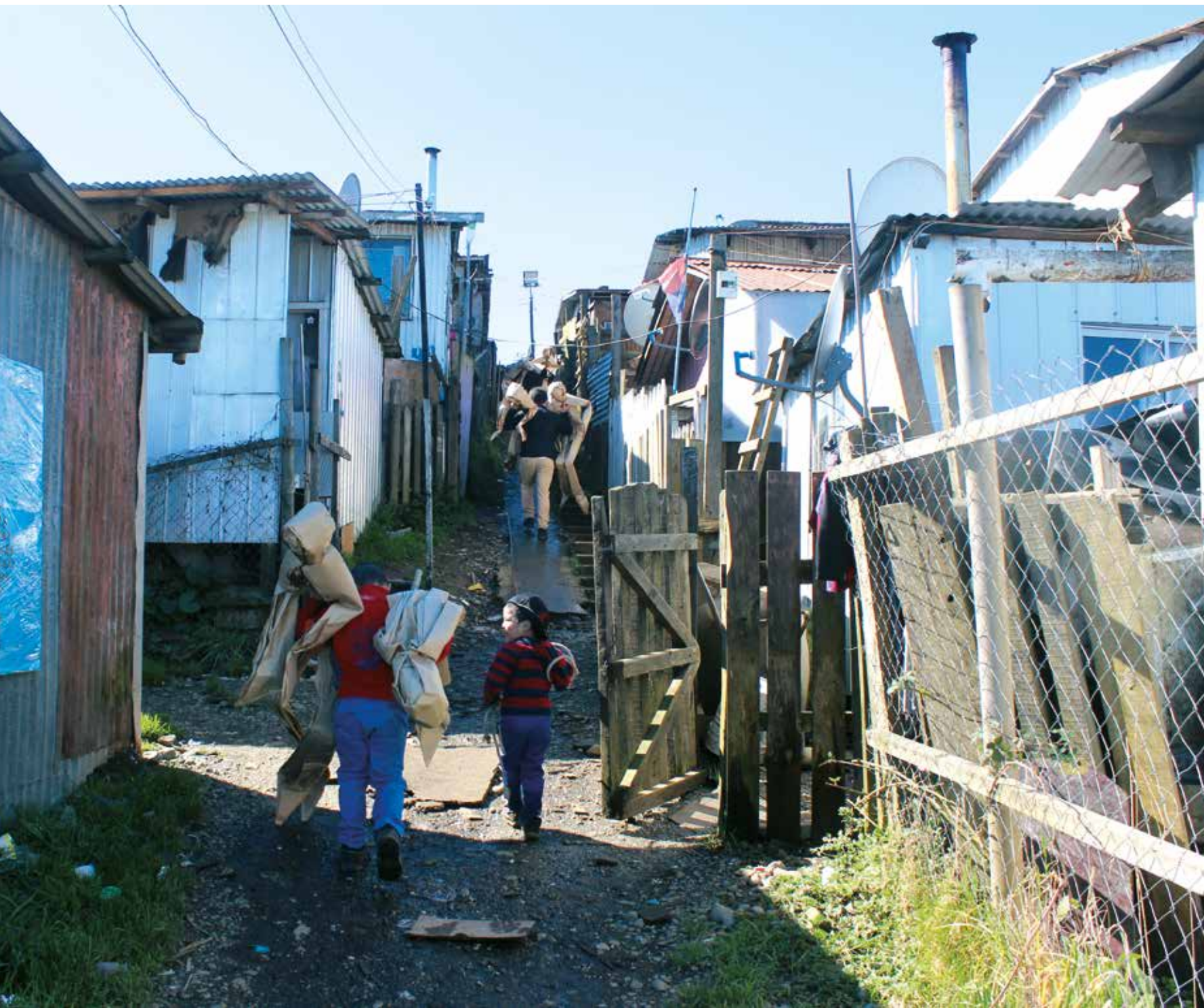
Campamentos Futuro Esperanza y Nuevo Amanecer