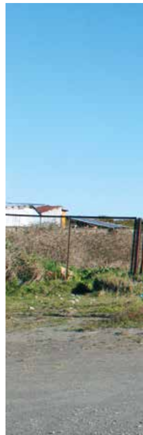
Laderas de Angelmó