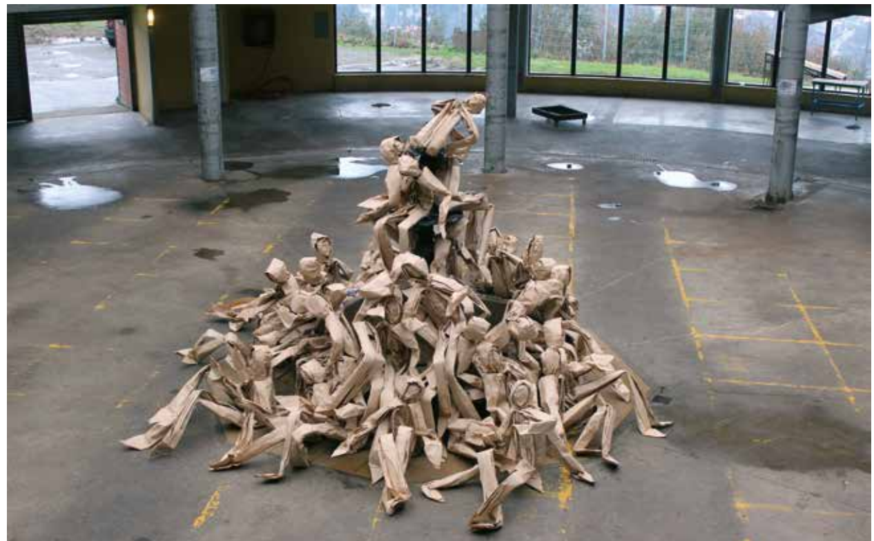
Mercado Municipal Presidente Ibañez