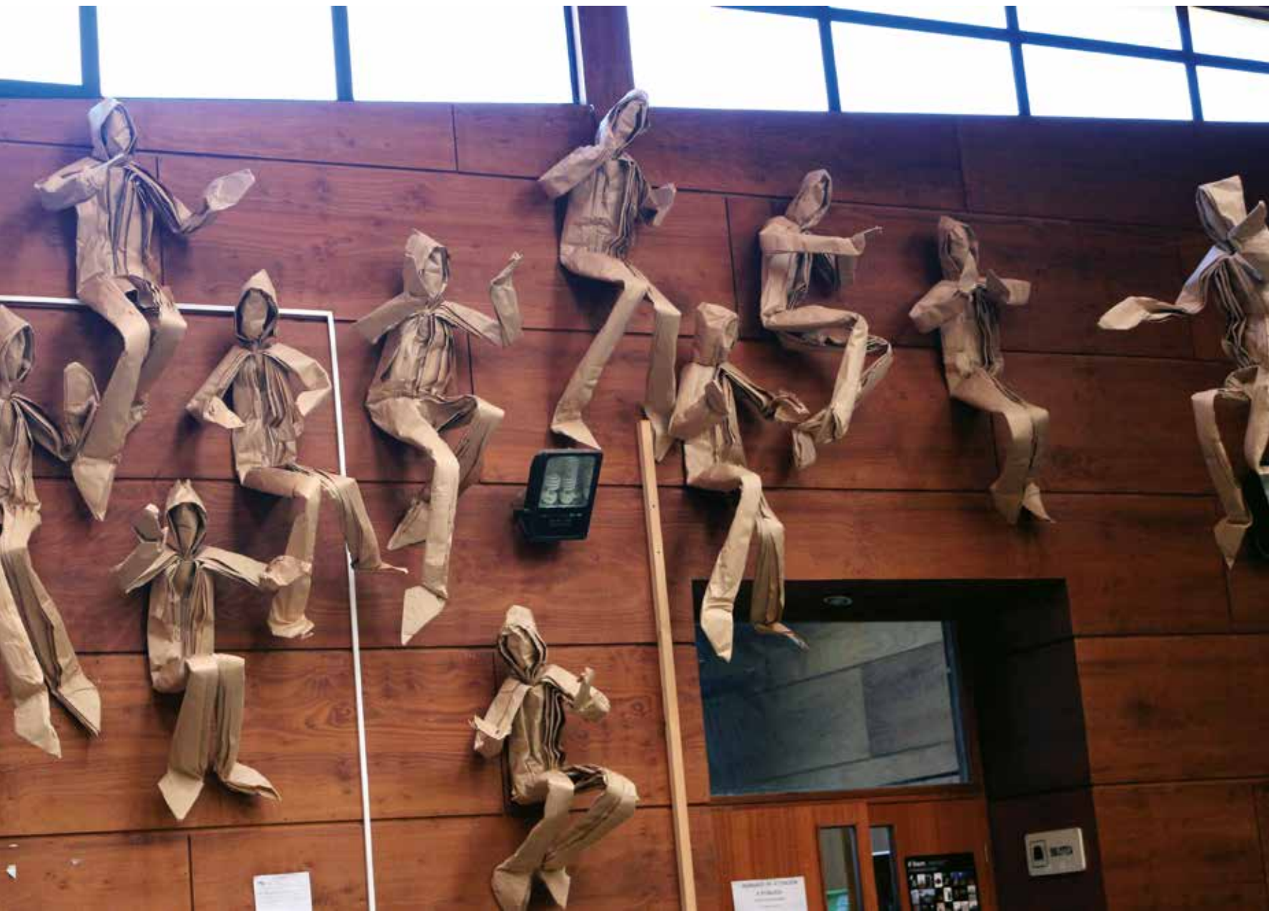
Centro Cívico Mirasol