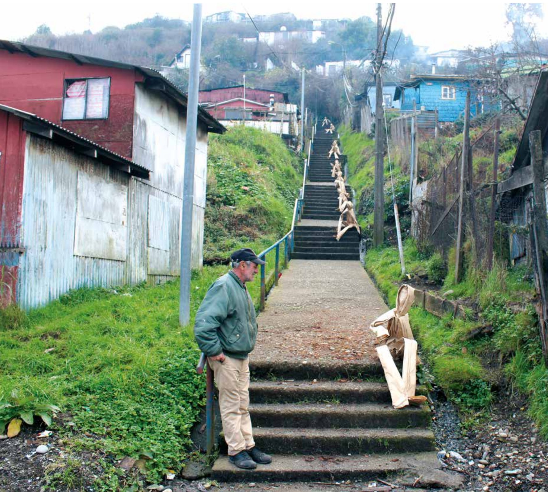
La ciudad de Puerto Montt , tiene 108 escaleras públicas , que juntas suman 5426 escalones con 4623