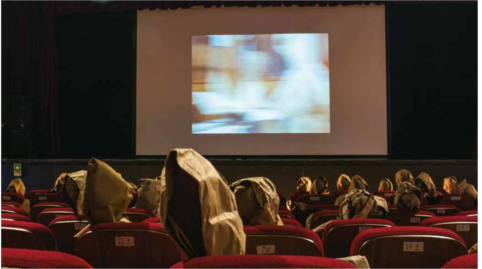
Teatro Diego Rivera