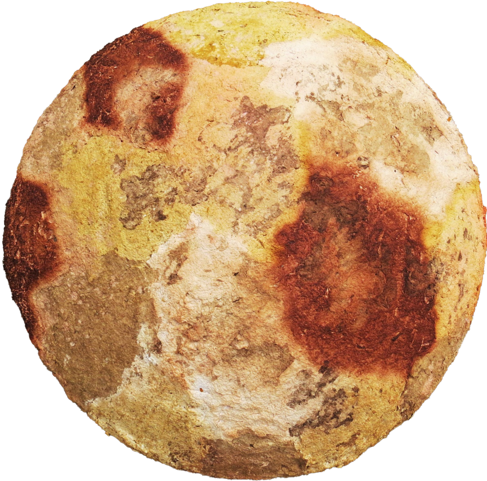
"Doğa ve Ben 003", Geriye Dönüşüm Kağıt, 42x42x10cm, 2024