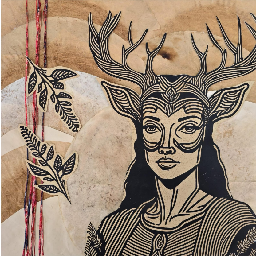
Back to Nature 05, Kağıt Kolaj, 40x40cm, 2024