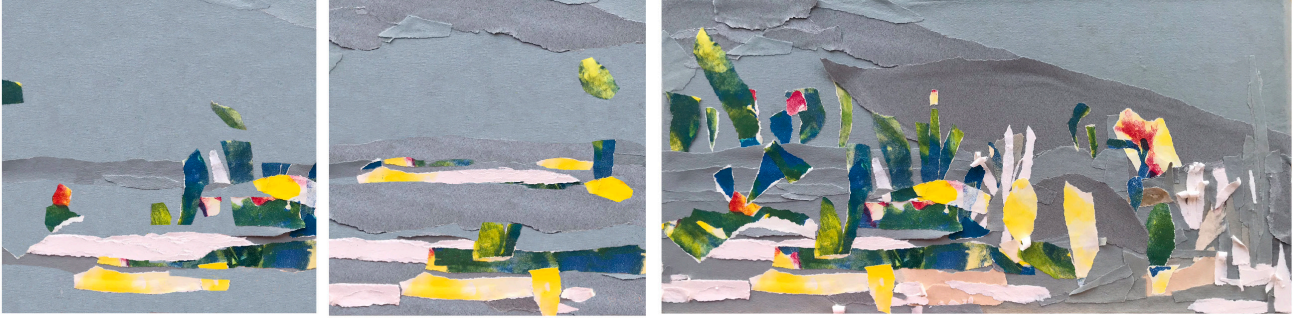
"Yosunların Fısıltısı", Tuval Üzerine Karışık Teknik (Triptik), 30x120cm, 2024