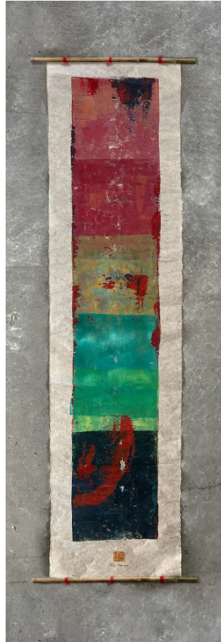
"Transition", Acrylic Monoprint, 35x150cm, 2024