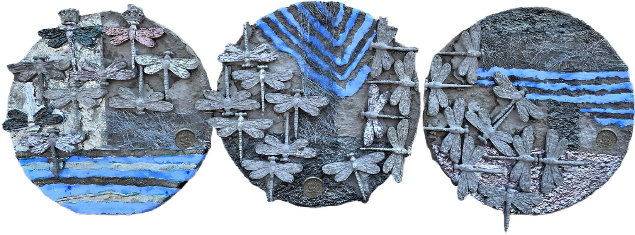
“Uç Uç Yusufçuk”, Tuval Üzerine Geriye Dönüşüm Kağıt Kolaj, 40x40 Cm (Triptik) 2024