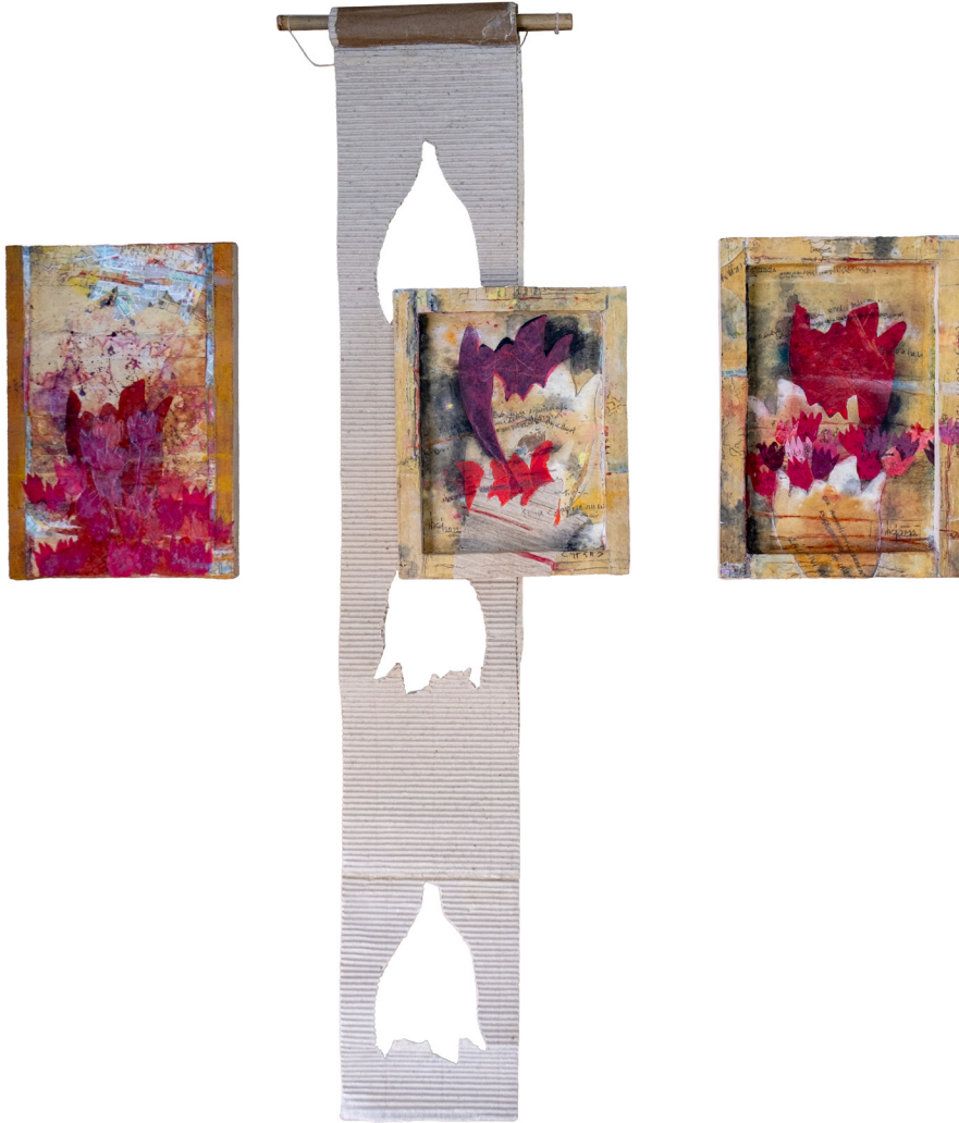
"We Are Nature", El Üretimi Kağıt, Harita Şeritleri Kolaj, Herbiri 35x25cm, 2024