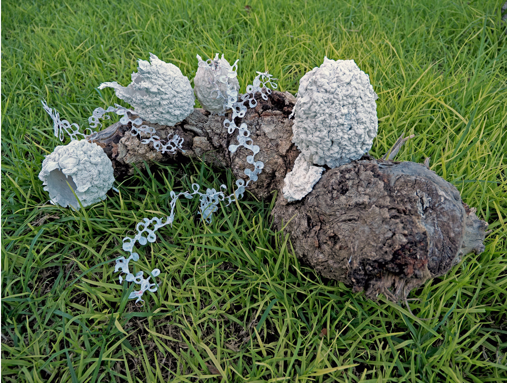
"Berbunga 01", Karışık Teknik, 50X20x15cm, 2024