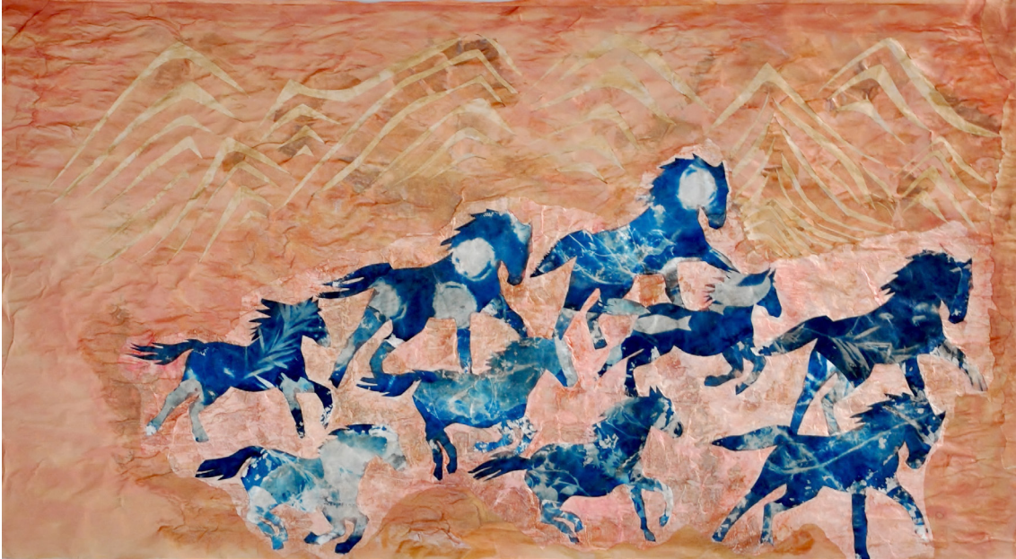
"Rüzgarla Beraber", Karışık Teknik, 70x130cm, 2024