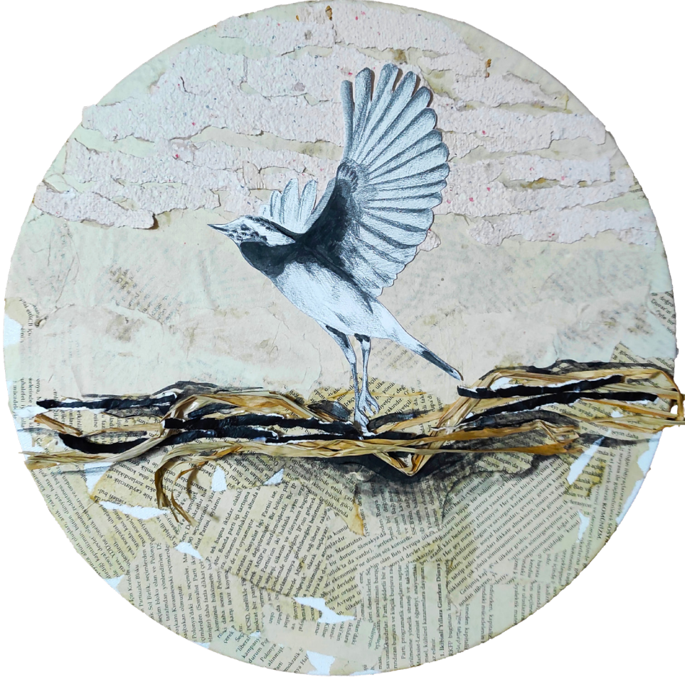
"Doğanın İzinde Kuşlar", Tuval Üzerine Kolaj, 40x40cm , 2024