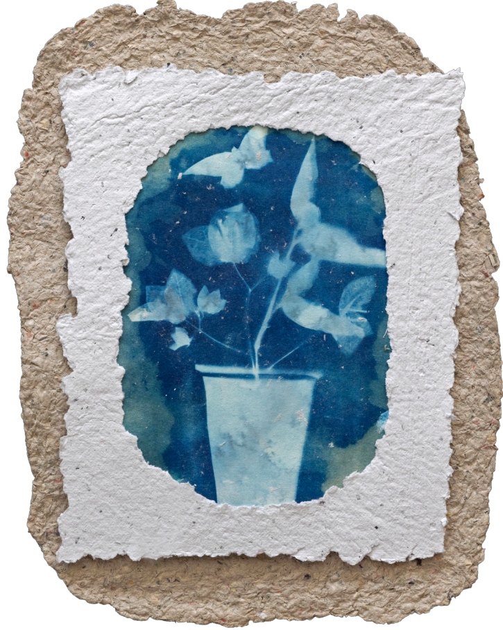
"İsimsiz 1", El Yapımı Kağıt Üzerine Cyanotype Baskı, 30x40cm, 2024