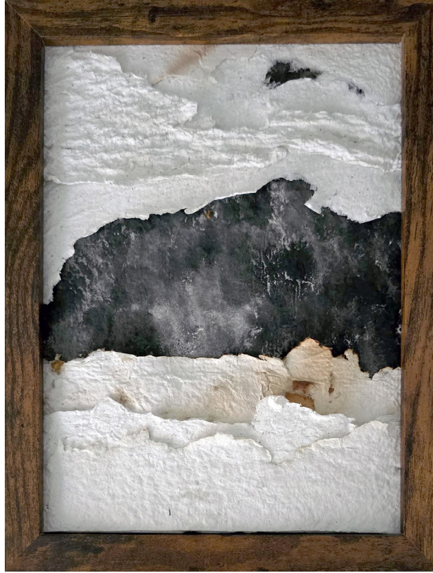
"Gece ve Sis", El Yapımı Kağıt, 23x17cm, 2024