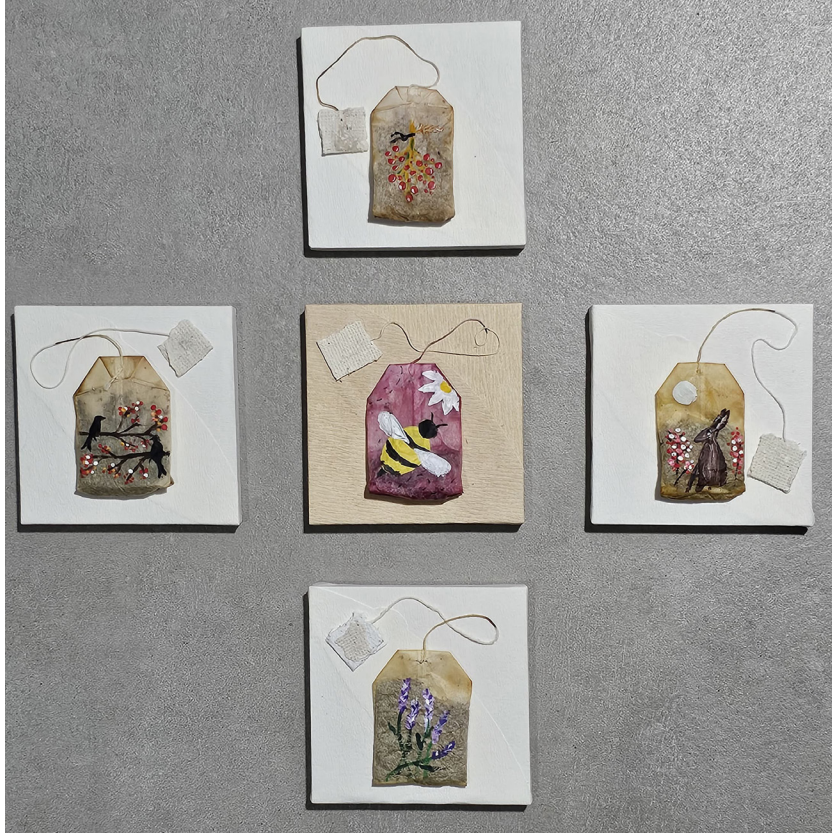
Natural Mixture, Dođal Kađıt Üzeri Akrilik Çizim, 40x40 cm, 2024