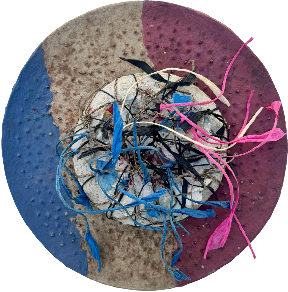
“Adak emberi ve Yakariř”, Karıřık Teknik, 2024