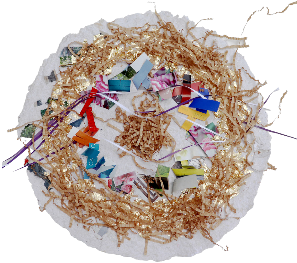
"Kuş Yuvası V", El Yapımı Kağıt Üzerine Kağıt Kurdele, 38,5x38,5 cm, 2024