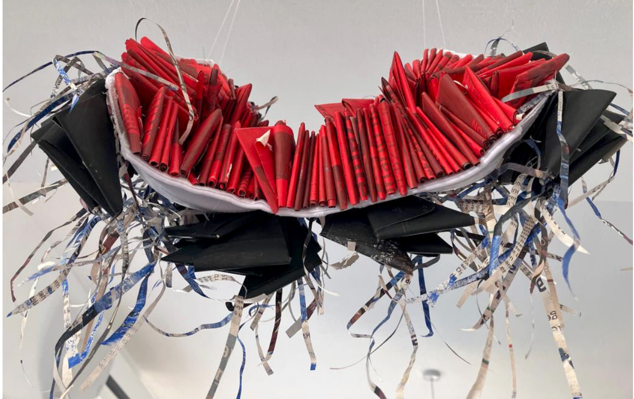
"Nuska(Muska)", Karişik Teknik, 2023