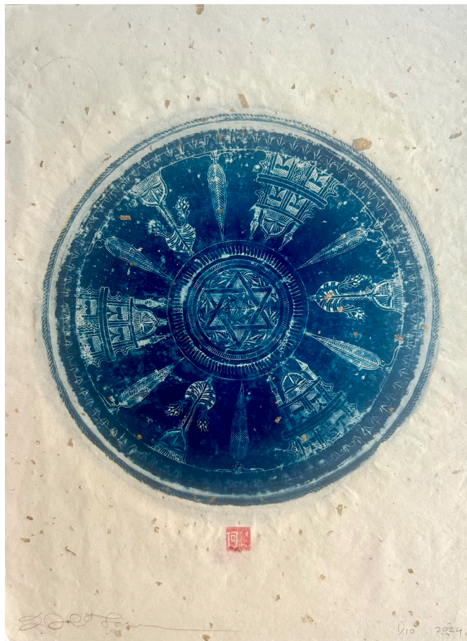
"Star Of David On An Ottoman Tray", Cyanotype On Watercolour Paper, 30x40cm, 2024