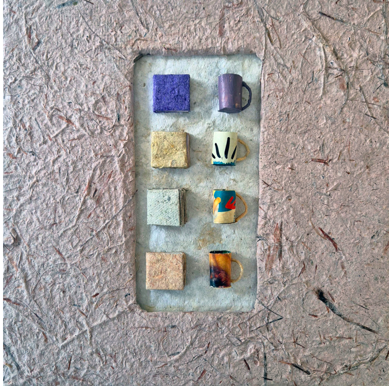
"Bir Kitap bir Kahve", El yapımı Kağıt Sanatı, 20x21cm, 2024