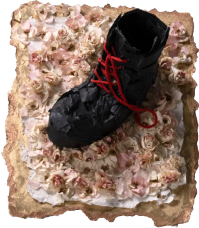
"Kağıt Ayakkabı", Kağıt Heykel, 46x40x18 cm , 2024