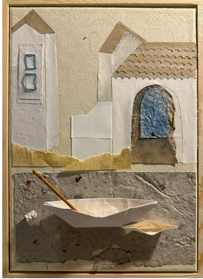
"Benim Dođam", El Yapımı Kağıtlar ile Kolaj, 31×22cm , 2024