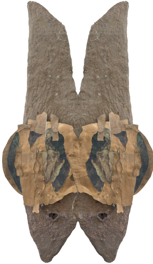
"A Piece Of Earth-1", Kağıt Kolaj, 2024